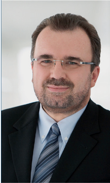
Prof. Dr. Siegfried Russwurm Siemens AG Mitglied des Vorstands

„Leistung braucht Förderung: Es ist unbestritten, dass unsere Zukunft schon heute entschieden wird. Wie wir in zwanzig oder dreißig Jahren leben werden, ob wir wettbewerbsfähig sein werden, das wird zu einem sehr großen Teil durch das beeinflusst, was wir heute beginnen. Umso wichtiger ist es, dass wir leistungsbereite junge Menschen begleiten und fördern, die diese Welt von morgen gestalten werden. Das Deutschlandstipendium ist in diesem Sinne eine Investition in die Zukunft, und es ist eine gute Investition.“